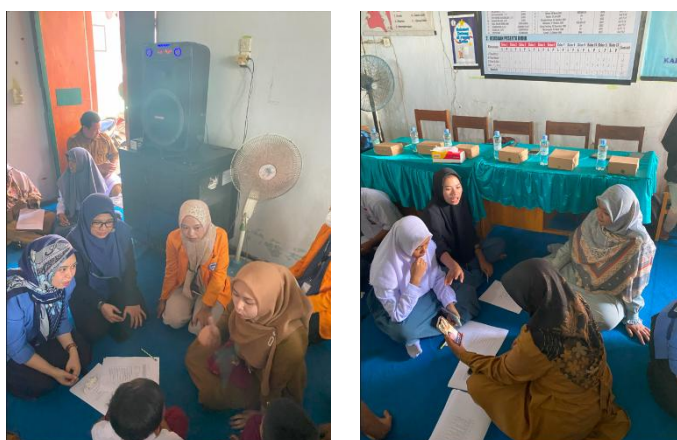
Gambar 1. Pemberian pre-test pada ABK