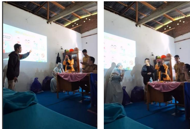
Gambar 2. Pemberian Materi Literasi

Temuan kegiatan ini memperkuat hasil penelitian (7) yang menunjukkan bahwa penggunaan media visual berupa video animasi efektif dalam meningkatkan pemahaman siswa tunagrahita terkait PHBS. Hasil pengabdian kami juga menunjukkan hal serupa, di mana siswa tunagrahita lebih antusias, mudah mengikuti, dan mampu menirukan contoh perilaku PHBS ketika materi disajikan melalui tayangan video yang atraktif. Perbedaannya, pada kegiatan ini media visual tidak hanya digunakan sebagai sarana penyampaian materi, tetapi juga dipadukan dengan metode prompt dan pembelajaran kooperatif, sehingga siswa tidak sekadar menerima informasi secara pasif, melainkan juga berinteraksi, berdiskusi, dan mempraktikkan langsung perilaku yang diajarkan (Gambar 2). Dengan demikian, media visual terbukti tidak hanya membantu pemahaman awal, tetapi juga berfungsi sebagai stimulus yang memperkuat proses belajar aktif dan kolaboratif. Pembelajaran lebih lanjut yang dapat diambil dari temuan ini adalah perlunya pengembangan media visual yang lebih kontekstual sesuai budaya lokal serta integrasi dengan metode interaktif untuk memastikan keberlanjutan perubahan perilaku pada siswa ABK.